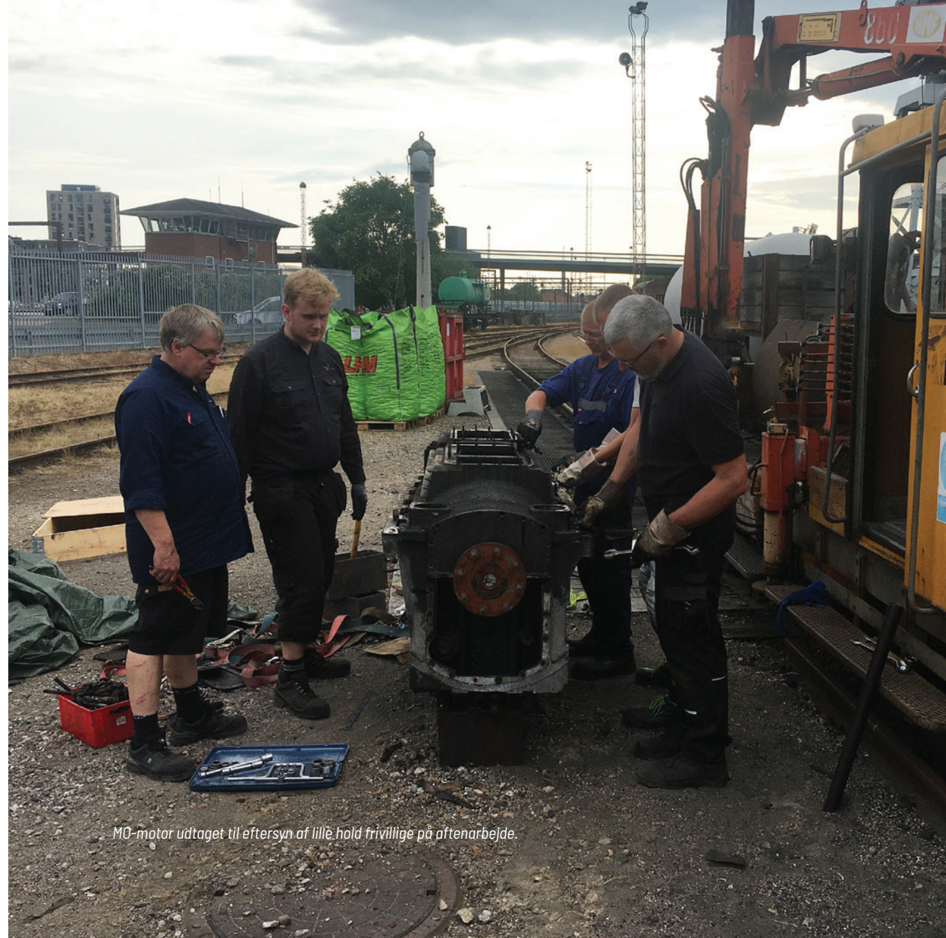
MO-motor udtaget til eftersyn af lille hold frivillige på aftenarbejde.

Også det store MO-projekt blev der arbejdet videre på – dels mellem nedlukningsperioderne og dels med opgaver, som blev løst eksternt. Arbejdet med MO 1954 skrider således fremad. Der er blevet arbejdet med revision af elmotorer, dynamoer m.m. men også med afdrejning af hjul, og også bogier blev færdige til samling. Den ene dieselmotor blev klar til prøveopstart, og den anden er godt på vej. Varmekedlen blev sendt til Vølund i Esbjerg til reparation, og rammerne blev færdige, så kedlen er klar til sandblæsning. På selve motorvognen er alt i undervognen demonteret og opgaverne klarlagt, og nedskrabning af maling er i gang, så den rette kulør kan findes.