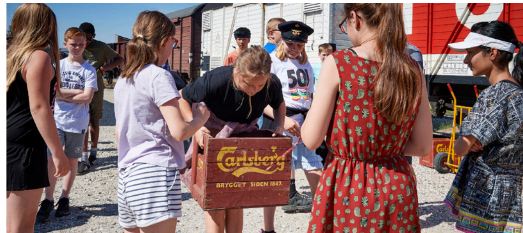
Under test af undervisningsforløbet "Tag toget til historien" med elever fra Risingskolen, juni 2020.

Det forgangne år har også for museets undervisningsdel været præget af corona-nedlukninger, både i foråret og også i slutningen af året. En positiv gevinst, der trods alt kom ud af forårets nedlukning, var statens puljer, der kunne søges til at større op om udsatte børns svigtende faglige indhold og læringsoplevelser.