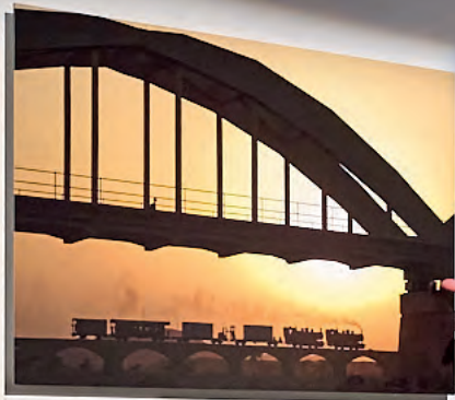
Stålbroen over Østfoldfjorden, Østfold, 1870.