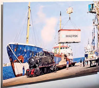
Maersk containerbåde og tog på havnen i Århus.

Anholdelser Kona var en vanlig jente som gikk på skole og arbeidet som lærer. Men hun var også en av de som var med på å bygge jernbanen. Hun var en av de som var med på å bygge jernbanen. Hun var en av de som var med på å bygge jernbanen.