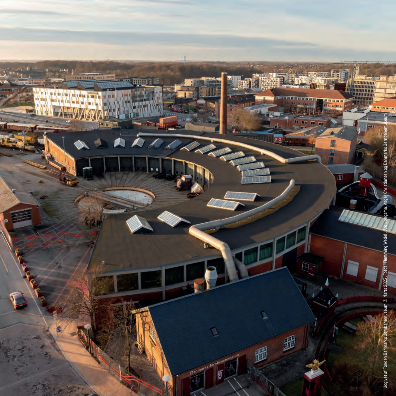
Udgivet af Fonden Danmarks Jernbanemuseum © Marts 2023.